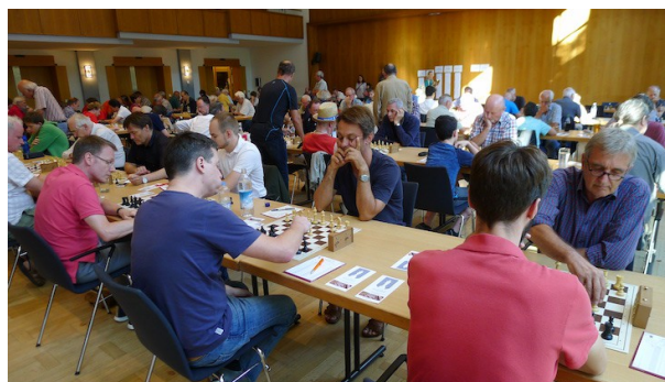
RTA-Spieler beim Pokalturnier 2018

Spielort: Kurhaus Bad Aibling, Wilhelm-Leibl-Platz, 83043 Bad Aibling Tel: 080 61 / 20 13 (Café-Restaurant am Park)