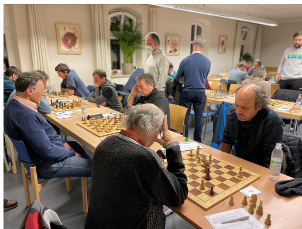
SF Deisenhofen 1 – SC Roter Turm 2

Jakob hatte drei Bauern ins Geschäft gesteckt und dafür alle gegnerischen Figuren auf dem Königsflügel auf ihren Ursprungsfeldern festgenagelt. Mittels eines erzwungenen Springeropfers konnte sein Gegner den Königsflügel schließlich doch noch entwickeln, worauf unklares Spiel mit Chancen auf beiden Seiten entstand. Da die Messe bereits gelesen war, wollte